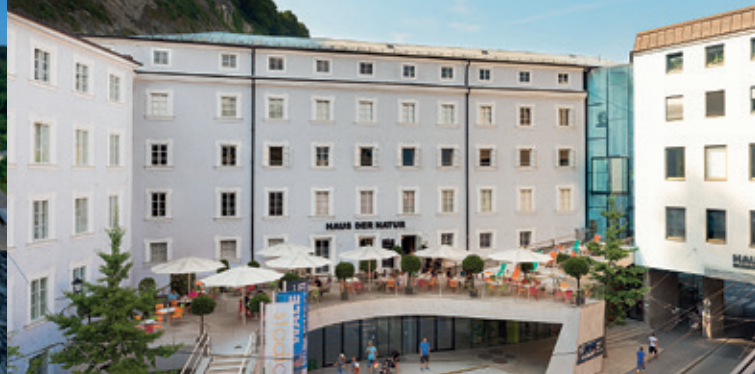
Haus der Natur - musée de la nature et de la technologie