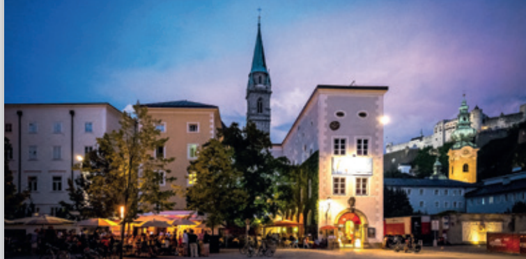
Musée d'Art moderne de Salzburg – Vieille ville (Rupertinum)