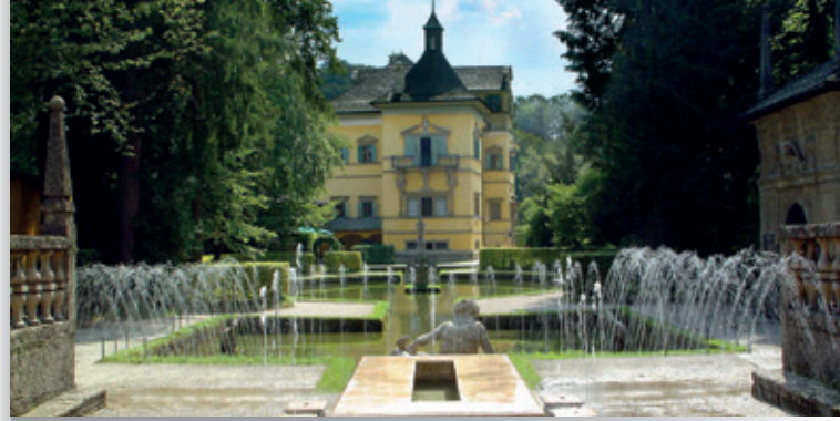
Jeux d'eau du château d'Hellbrunn

Salles d'apparat Residenzgalerie Musée de la cathédrale Musée Saint-Pierre