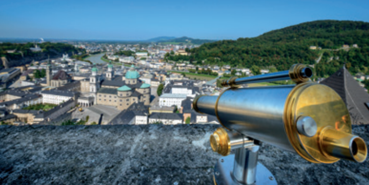
Vue du Mönchsberg sur la vieille ville